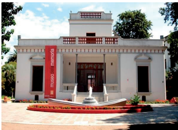
Museo de la Memoria - Intendencia de Montevideo

En referencia a la documentación administrativa del MUME y del relevamiento somero de la documentación relacionada a las colecciones de los museos, en este caso,